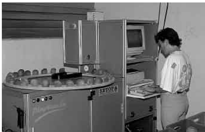
Utilisation du « Pimprenelle » sur pêches