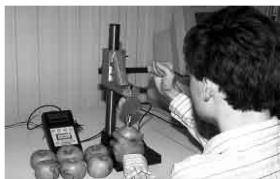
Utilisation du Pénéfel sur pommes

Ce document présente les outils et modes opératoires. Les différents points abordés sont détaillés dans une brochure Ctifl, « Agréage fruits et légumes, mode d'emploi ».