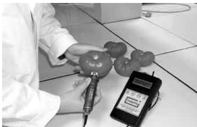
Utilisation du Durofel sur tomates