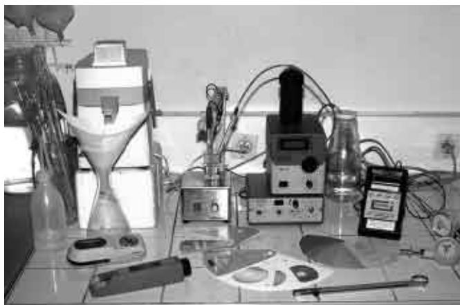
Préparation des jus et mesures de l'acidité