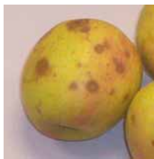
Symptômes sur pomme (Pink Lady® Cripps Pink)