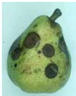
Symptômes sur poire Doyenné du Comice

laissant une cavité arrondie, saine à l'intérieur. Ce caractère semble être caractéristique (à vérifier). La tache peut craqueler en surface, se creuser, et un duvet mycélien gris-verdâtre peut apparaître dans la cavité. La recherche de spores d' Alternaria ou de Stemphylium doit être effectuée avant d'écarter ces deux agents pathogènes. L'isolement est cependant nécessaire pour confirmer l'hypothèse.