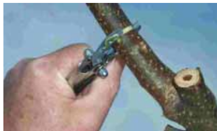
Photo 1 : Réalisation de l'incision sur latérale

NB : En France, la société Triangle (1) propose deux modèles de pince à incision annulaire qui conviennent pour réaliser les incisions sur latérales.