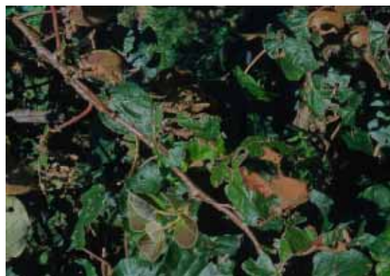
Photo 2 : Feuillage du verger de kiwi, 1 mois après le passage de la grêle

Les récoltes de pêches, pommes et autres fruits dans l'environnement immédiat sont totalement détruites. Sur kiwi, les fruits situés dans la zone sans filets paragrêle sont également détruits, les feuilles sont déchiquetées, et les bois très endommagés. La photo ci-dessus, prise environ un mois après l'événement, montre le démarrage de nouvelles pousses.