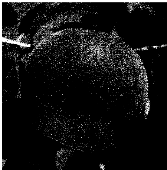
Summer Lady(cov), une pêche jaune tardive ferme et de bonne qualité gustative qui produit des fruits de calibre A-AA dominant.

• Nombre d'heures de main d'œuvre nécessaires pour produire une tonne de fruits commercialisés en calibre A et plus : ratio heures/tonne A+ (B et plus pour les variétés très précoces). Ce dernier ratio doit permettre d'éviter le productivisme exagéré qui aurait tendance à minimiser au maximum le ratio heures/tonne en rédui-