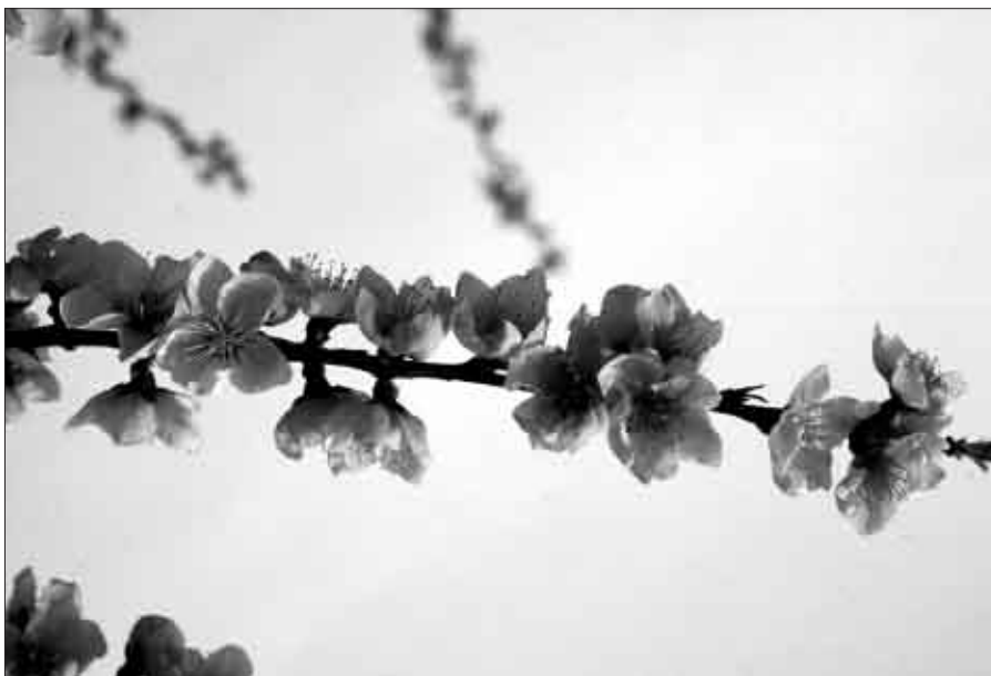
Floraison d'un rameau de pêcher

Of all the methods tested, only one - derived from the Weinberger method - allows discrimination among the different years. The lower the cumulative number of hours at temperatures below 5°C, the greater the risk of floral bud drop.